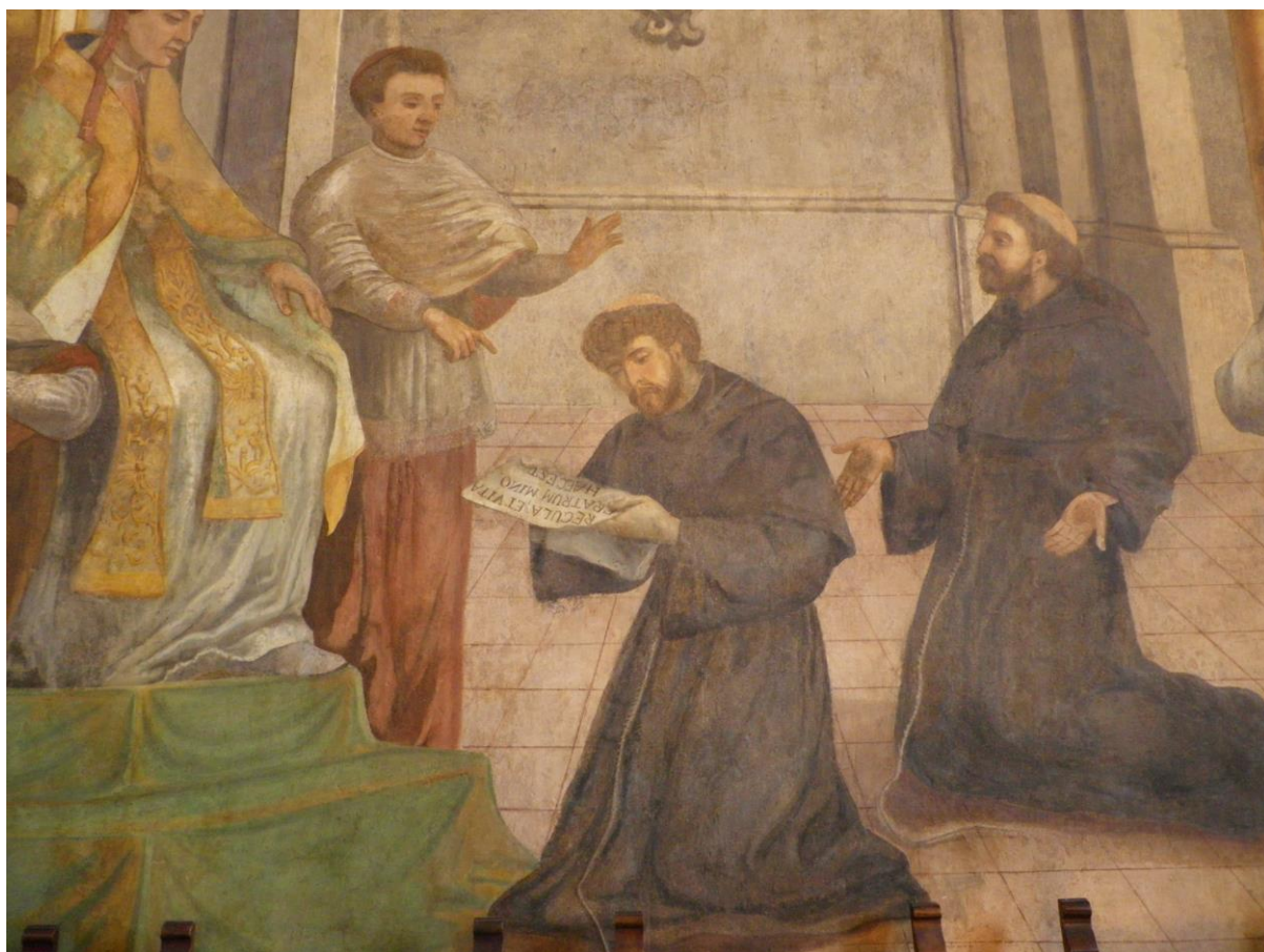
Fresk från 1700-talet i refektoriet i Sacro Convento i Assisi (klostret vid S:t Franciskusbasilikan) som visar helgonet som tar emot den påvliga bullan med godkännandet av Regeln den 29 november 1223 av Påven Honorius III

Guds Vilja och Försyn är alltid grunden och styrkan i varje ordens eller kongregations uppkomst och liv. Kyrkans numerärt största klosterorden, Mindrebröderna, fick liv genom Helige Franciskus´ av Assisi öppenhet för Herrens Vilja att ”restaurera” Kyrkans inre liv. ”Assisis lille Fattige” (il Poverello di Assisi), som vår ordensgrundare ofta kallas för, var helt uppfylld av sin önskan och strävan efter att ”följa vår Herres Jesu Kristi Heliga Evangelium genom att leva i lydnad, utan egendom och i kyskhet.” (Regeln kap. 1 – se häftet med Regelns hela text).