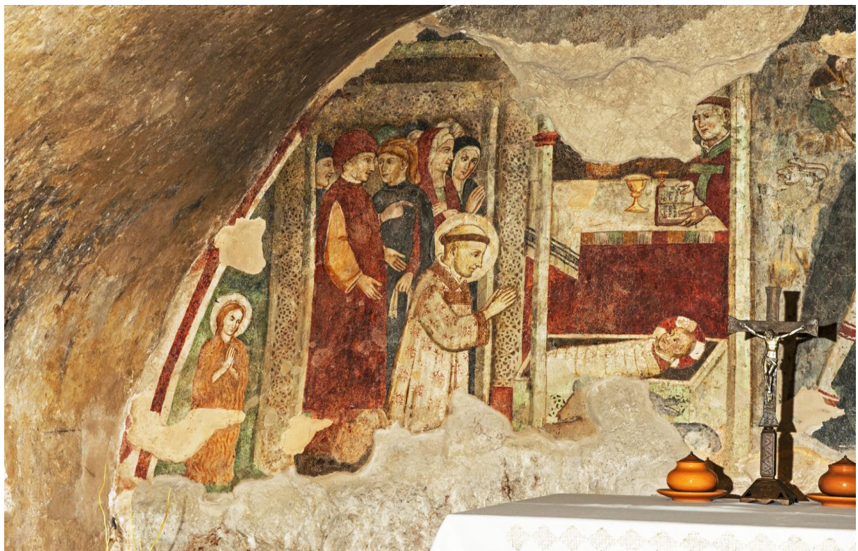
Fresk på väggen i kapellet i Greccio där Helige Franciskus ordnade med den första julkrubban