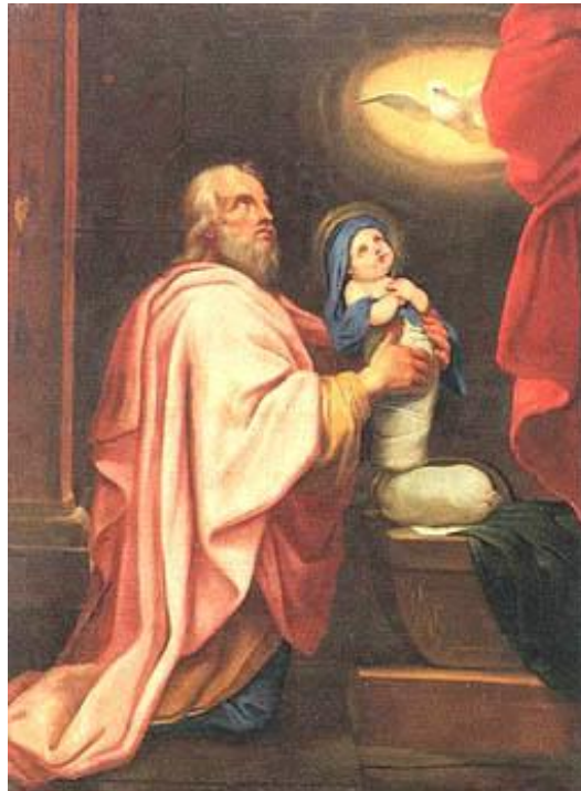
Den Helige Joakim, Jungfru Marias fader, tillsammans med Maria som barn