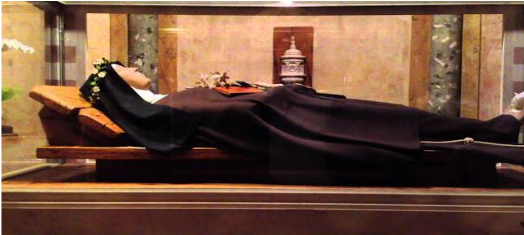
Heliga Claras grav i Assisi

Gud, vår Fader, Du visade fattigdomens väg för den Heliga Clara. Låt oss på hennes förbön följa Kristus, fattig i anden, och nå vårt mål, att se Dig som Du är. Genom Din Son Jesus Kristus, vår Herre och Gud, som med Dig Fader och den Helige Ande lever och råder från evighet till evighet. Amen.