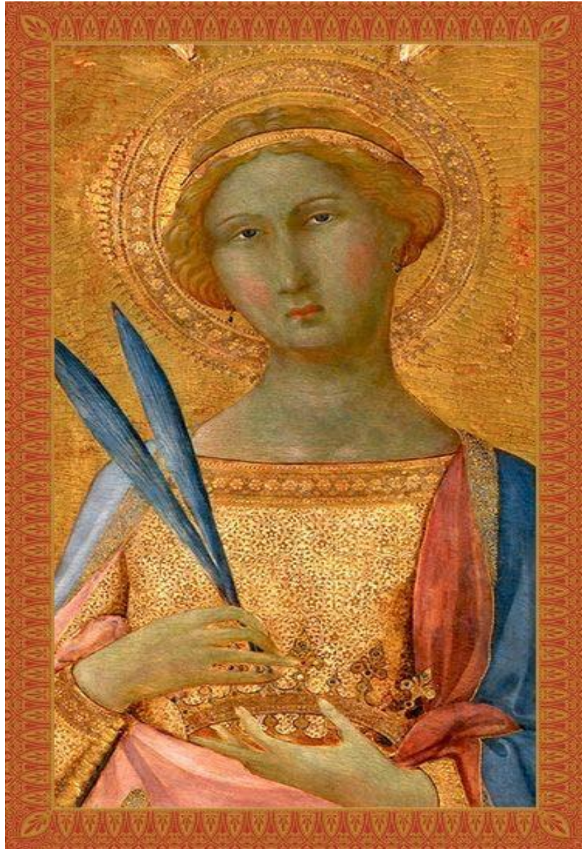
Heliga Corona, martyr i Syrien vid 16 års ålder cirka år 165 Skyddhelgon för skattsökare, mot spelberoende och epidemier Festdag: 14 maj