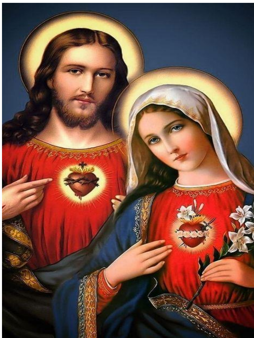
Jesu och Marie Förenade Hjärtans månad