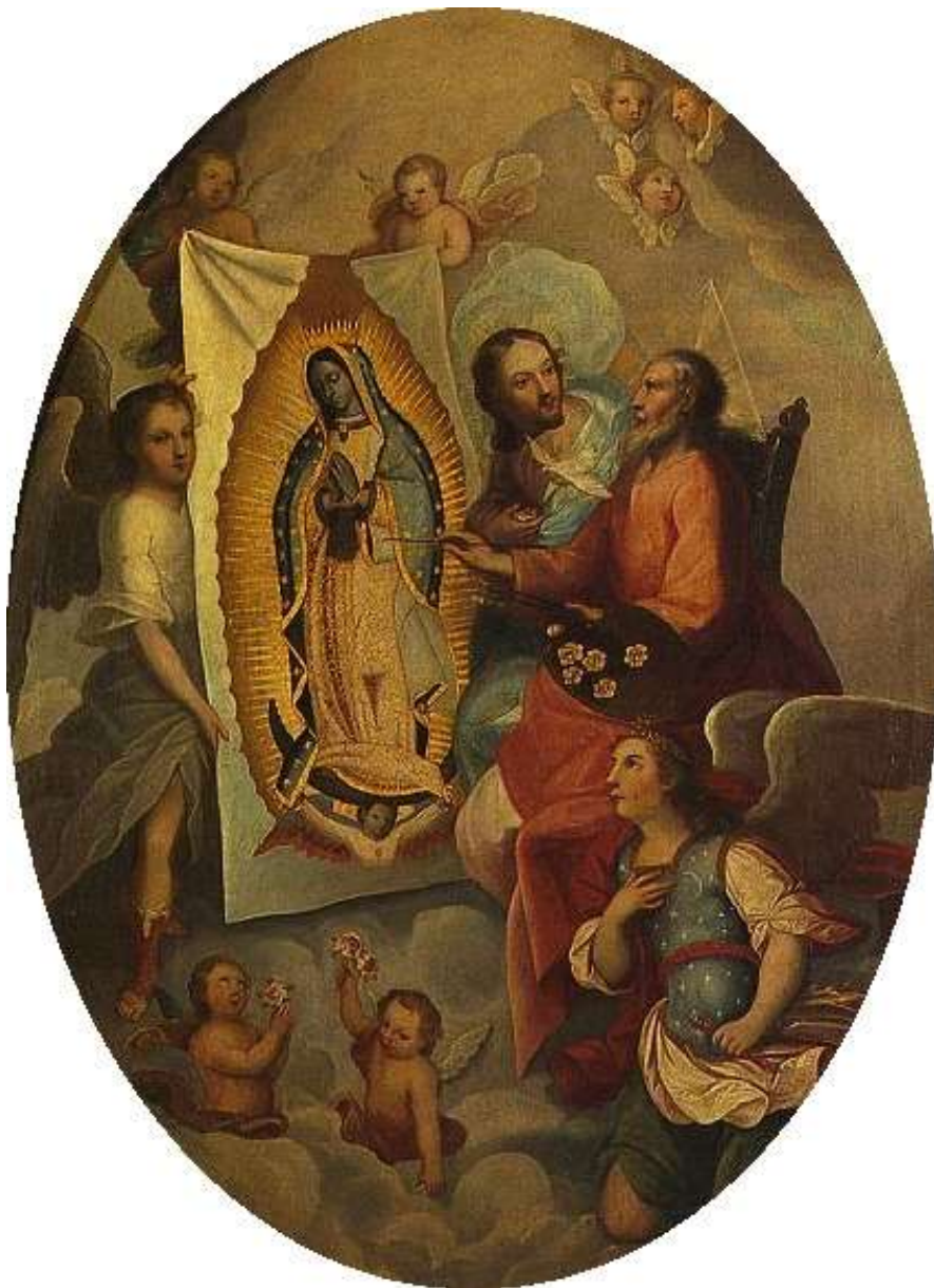
Oljemålning från 1700-talet: Gud Fader skapar bilden av Guds Moder inför uppenbarelsen

Om du går in på nätet och söker under Our Lady of Guadalupe, eller på andra språk, finns mycket mer information att få.