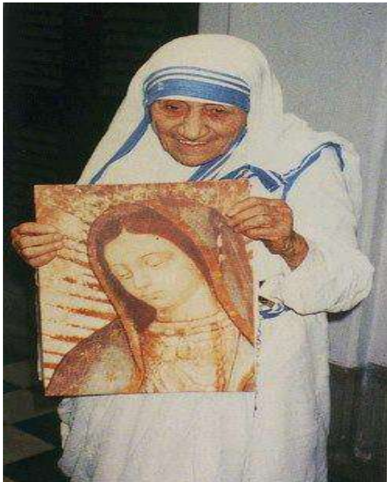
Heliga Teresa av Calcutta visar glatt upp en bild av Vår Fru av Guadalupe

”Är inte jag din Moder, och är inte jag här!”