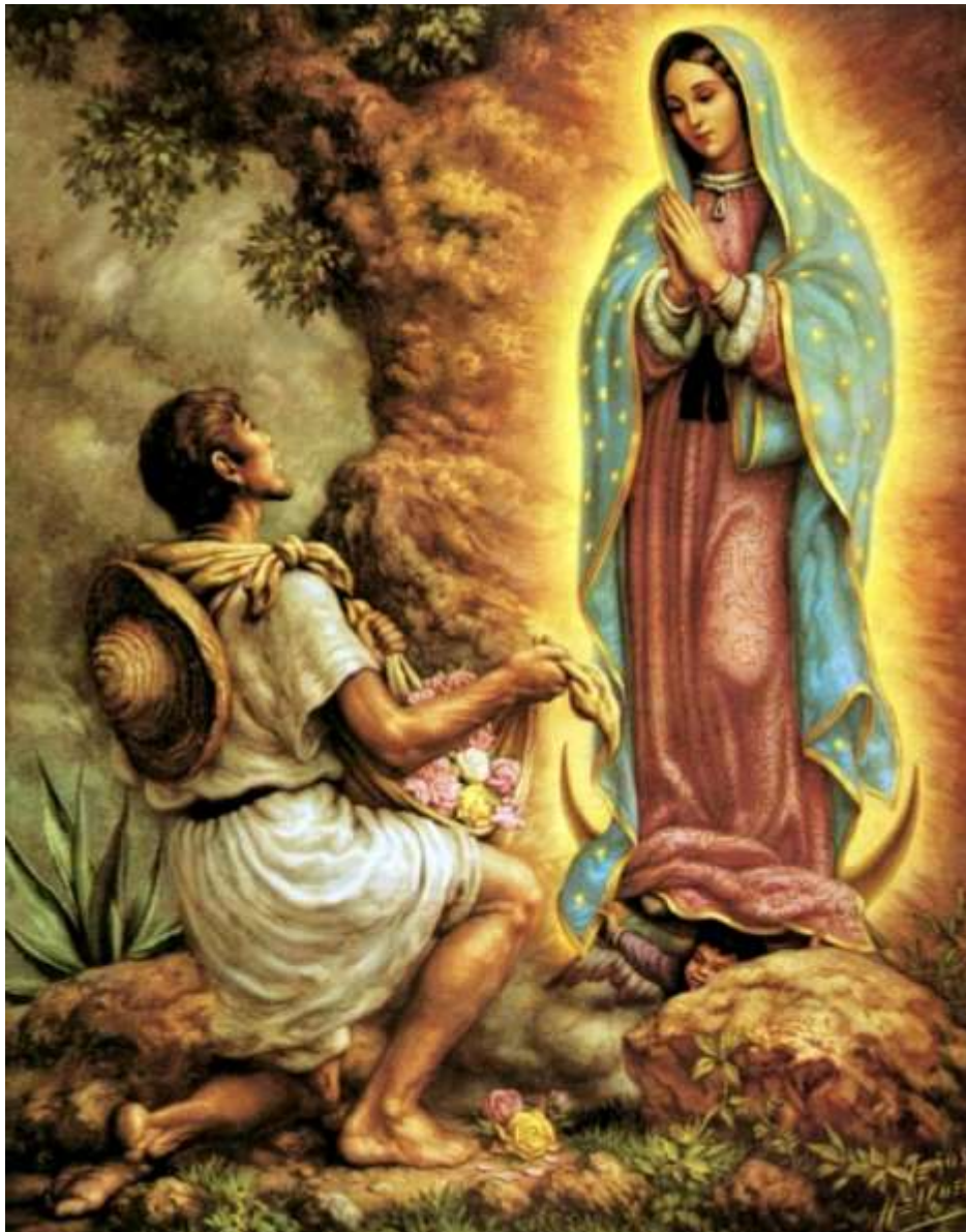
Nådebilden av Vår Fru och Moder av Guadalupe och några märkliga fenomen:

+ Och en krans av tolv stjärnor bar hon på sitt huvud.