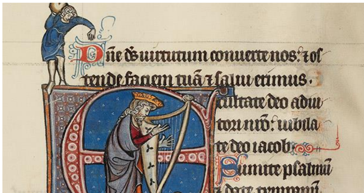
Kung David sjunger psalmer (illustration från ca 1270-80)

Antifon: Herre, kom inte ihåg våra och våra faders överträdelser. Straffa oss inte för våra synder.