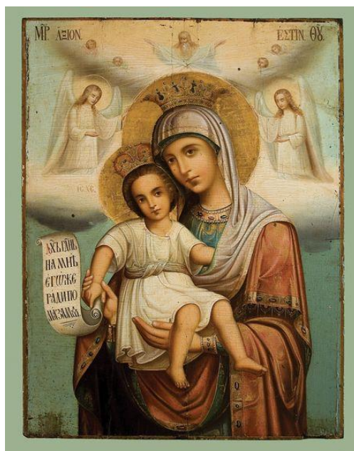
Axion Estin ikonen, klosterhalvön Athos, Grekland