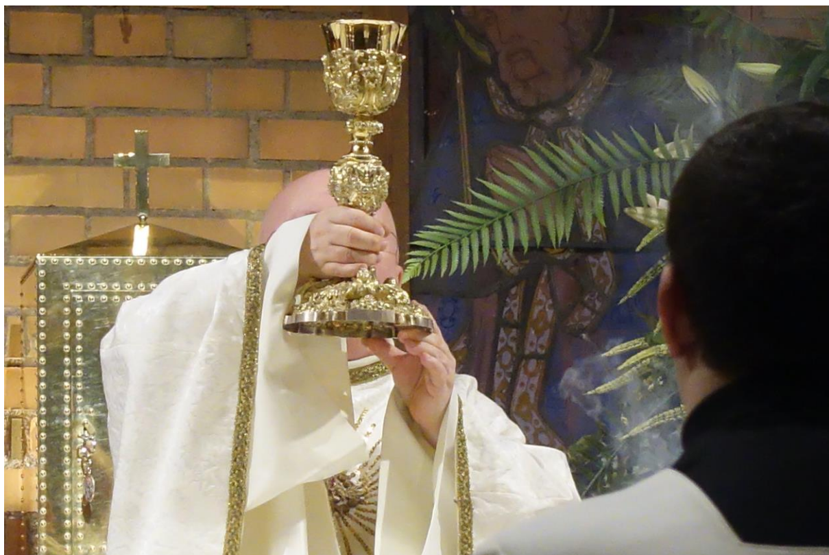
Jesu Dyrbara Blods månad

www.katolskajonkoping.com/livestreaming www.youtube.com/user/catomedia75/ www.facebook.com/katolskajonkoping/videos/