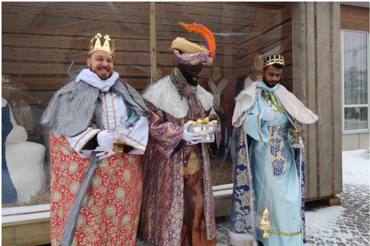
På bild syns Heliga Tre Konungar (De Tre Vise Männen) under Epifania år 2023