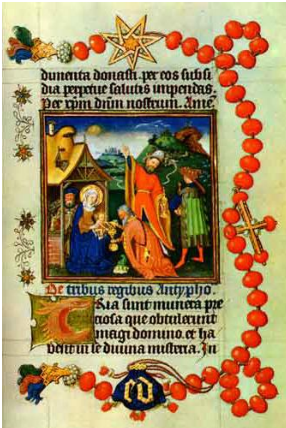
Ur Catherine of Cleves (1417–1479) bönbok