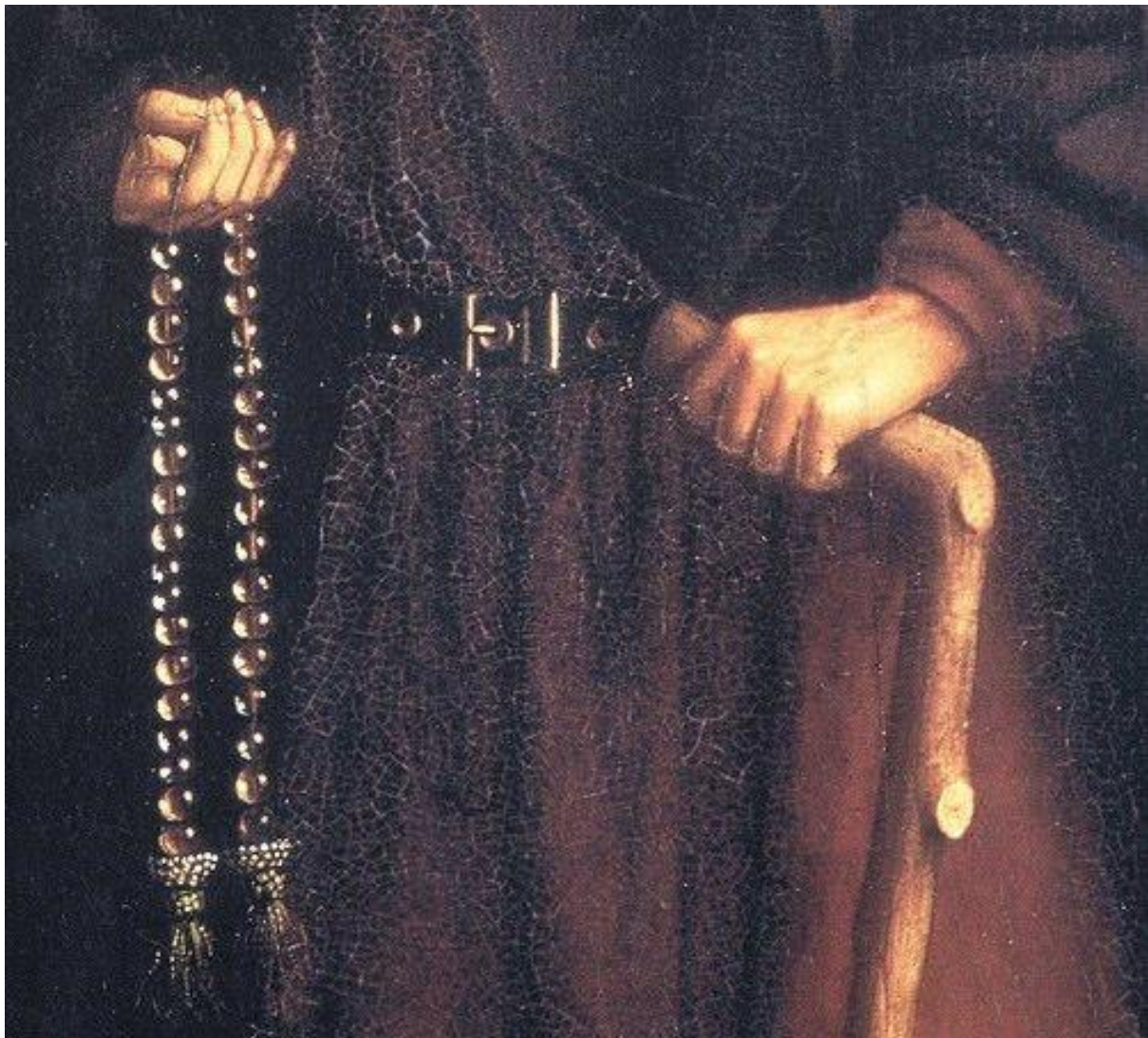
Detalj från Eremiterna i Ghent – Tillbedjan av det Mystiska Lammet av Jan & Hubert van Eyck, 1432